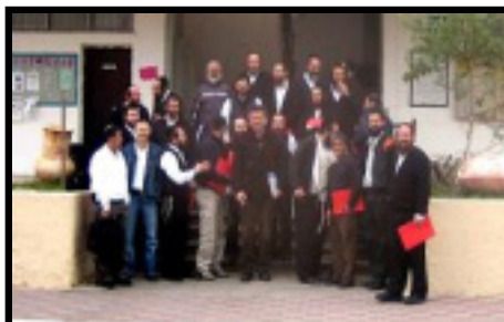
השתלמות פס"ח לצוות נתניה בבה"ד 16

לתשומת ליבכם! מי שמדפים את העלון יש לגנוז את עמוד 2 עם דברי התורה